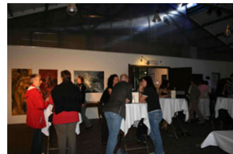
Werkschau in der Zeche Waltrop während der "Extraschicht"