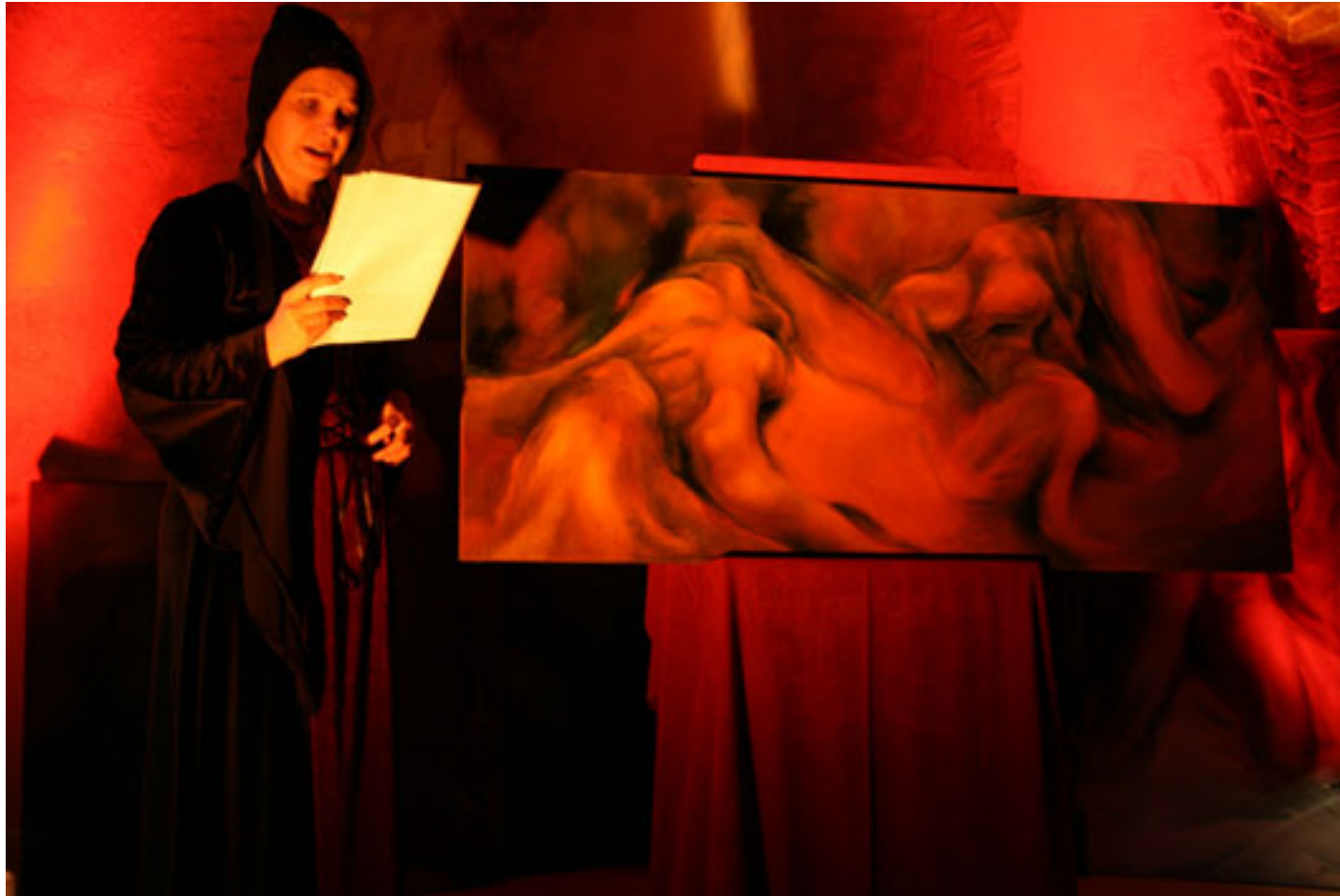
Dialog zwischen Dante und Vergil und Werkschau der beiden Künstlerinnen in der Kapelle