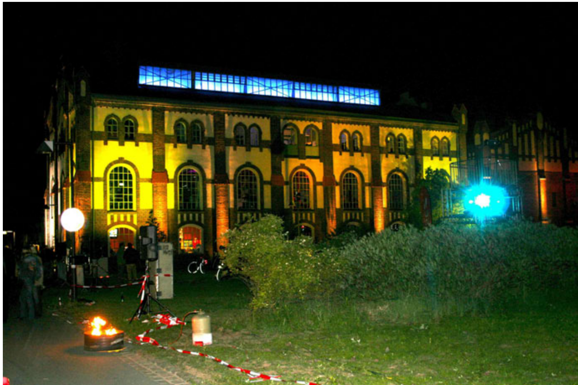
Industriekultur: Die Zeche Waltrop des Dortmunder Hafen