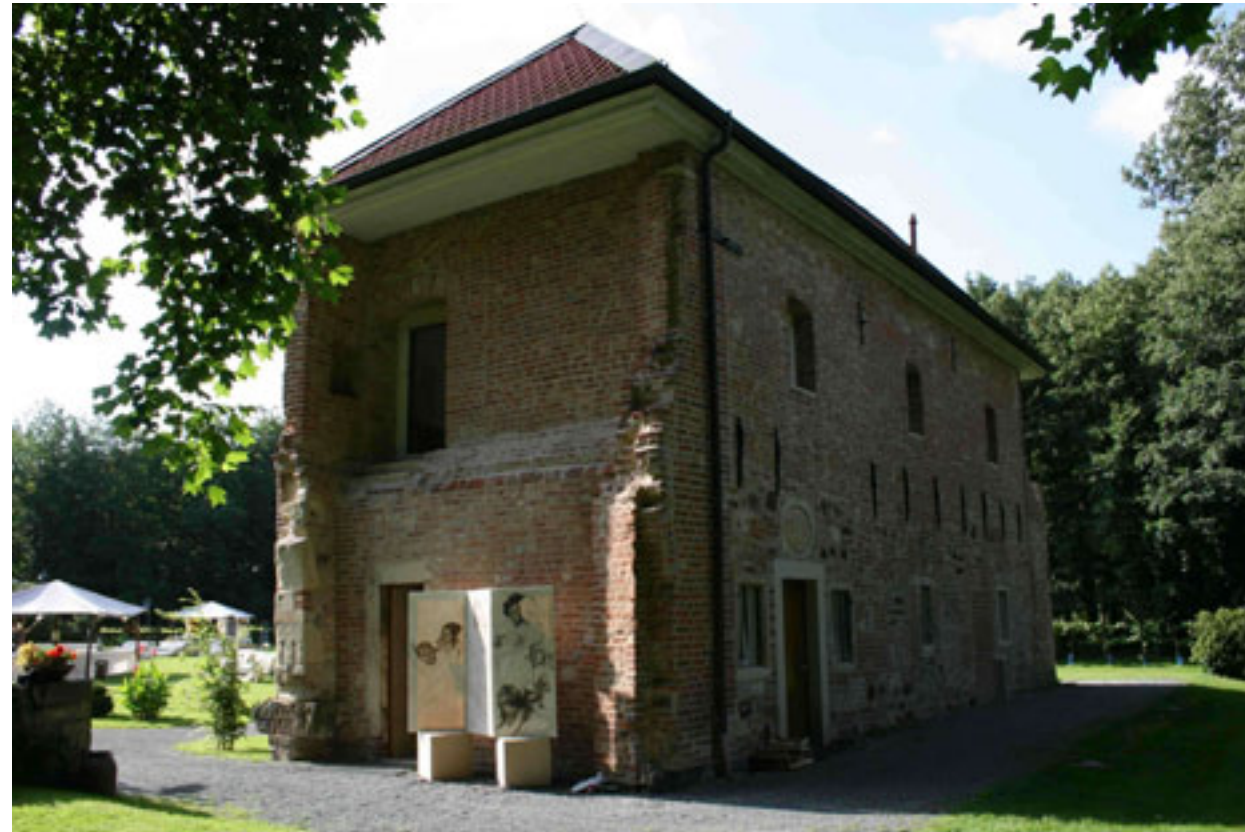
Ausstellung im Rahmen eines mittelalterlichen Spektakels im Schloß Sythen in Haltern.